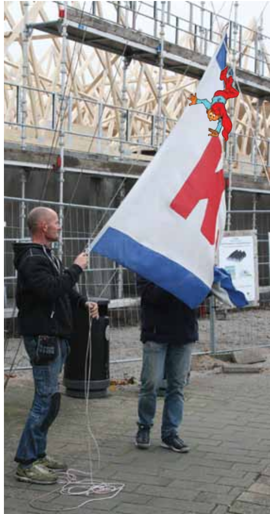
Kim fik standeren ned og fomanden bød på øl....