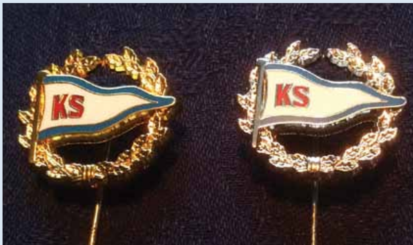
På generalforsamlingen blev der uddelt nye jubilæumsnåle.