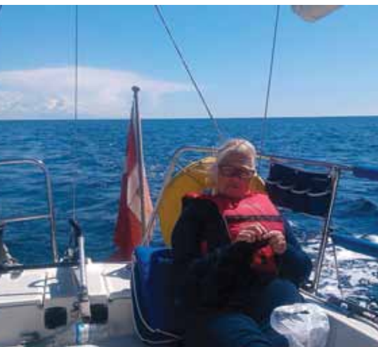
Tina strikker og holder udkig.

Ankomsten til Sverige via Trubaduren søgte vi en havn – jeg kiggede på Geo og fandt en lille havn på en ø umiddelbart inden for i skærgår-